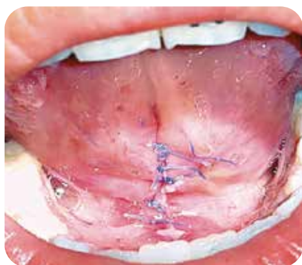
Control de 3 días