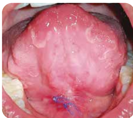
Control a los 10 días