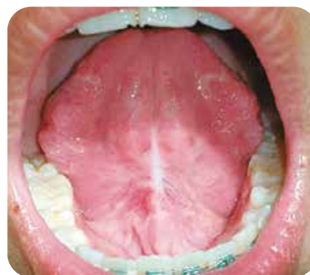
Control a los 21 días