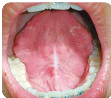
Control a los 21 días