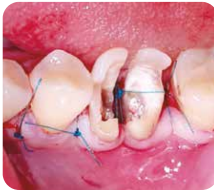
Premolarización + Sutura