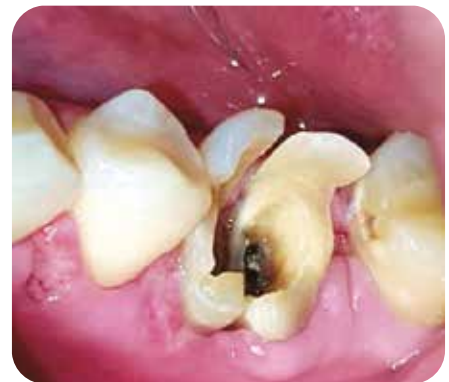
Retiro de Puntos + Control a los 8 días Resultado