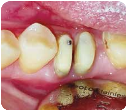
Control 21 días