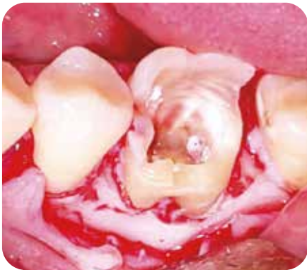
Levantamiento de Colgajo