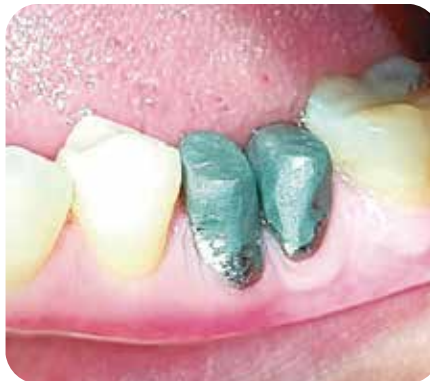
Control 3 meses